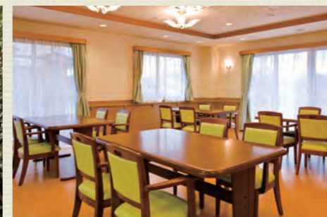
各所に椅子やテーブルを設置。食堂や談話室は自由にご利用可能です。居室以外にも居場所がたくさんあります。