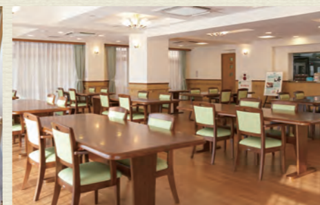
各所に椅子やテーブルを設置。食堂や談話室は自由にご利用可能です。居室以外にも居場所がたくさんあります。