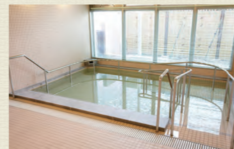
一般浴のほか、家庭のお風呂のような個浴、寝たきりの方も入浴可能な特殊浴槽があり、お身体の状態に合わせた入浴が可能です。