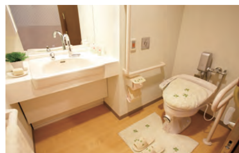
【洗面台】蛇口は自動水栓です。 【温水洗浄便座付トイレ】介助バー、コールボタンも完備