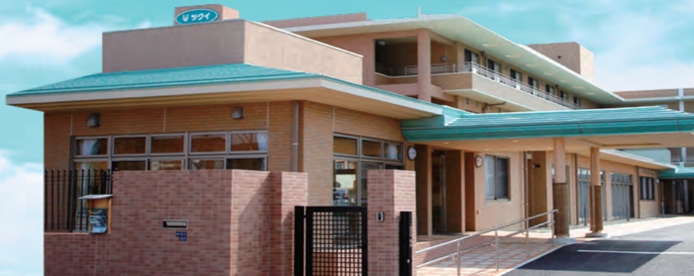
土地・建物の権利形態 / 建物賃借(2009年2月より25年契約)