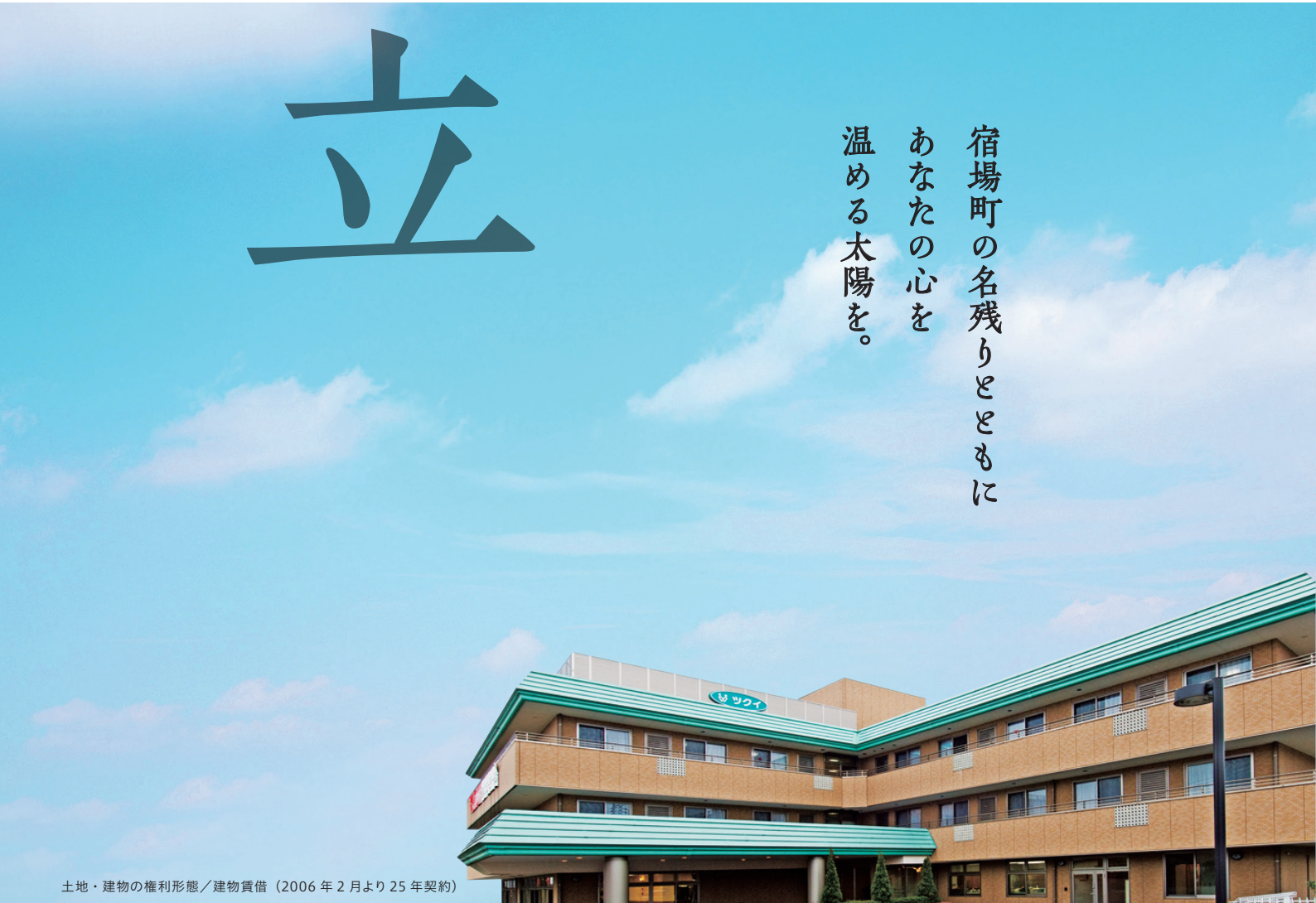
土地・建物の権利形態/建物賃借(2006年2月より25年契約)

特定施設入居者生活介護 介護予防特定施設入居者生活介護 介護保険事業所番号1372105369