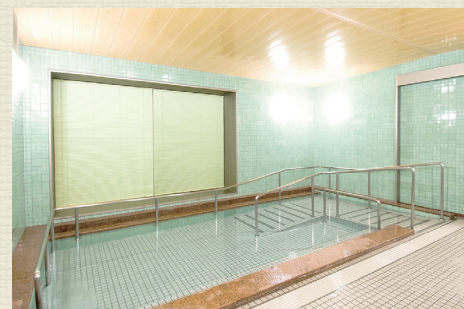
一般浴のほか、家庭のお風呂のような個浴、寝たきりの方も入浴可能な特殊浴槽があり、お身体の状態に合わせた入浴が可能です。

「その日の気分やメニューが選べたら、食事はもっと楽しいはず」そんな思いから、数種類のメニューから、好きなものを選べる『セレクト食』を実施しています。 ※施設により実施内容が異なりますので、お問い合わせください。