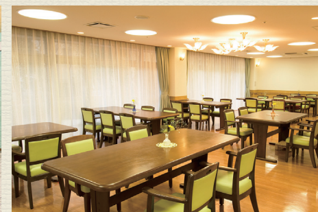
各所に椅子やテーブルを設置。食堂や談話室は自由にご利用可能です。居室以外にも居場所がたくさんあります。