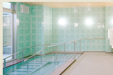
一般浴のほか、家庭のお風呂のような個浴、寝たきりの方も入浴可能な特殊浴槽があり、お身体の状態に合わせた入浴が可能です。