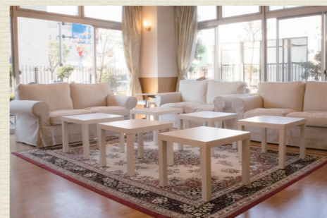
各所に椅子やテーブルを設置。食堂や談話室は自由にご利用可能です。居室以外にも居場所がたくさんあります。