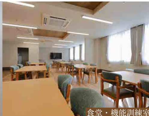
食堂・機能訓練室