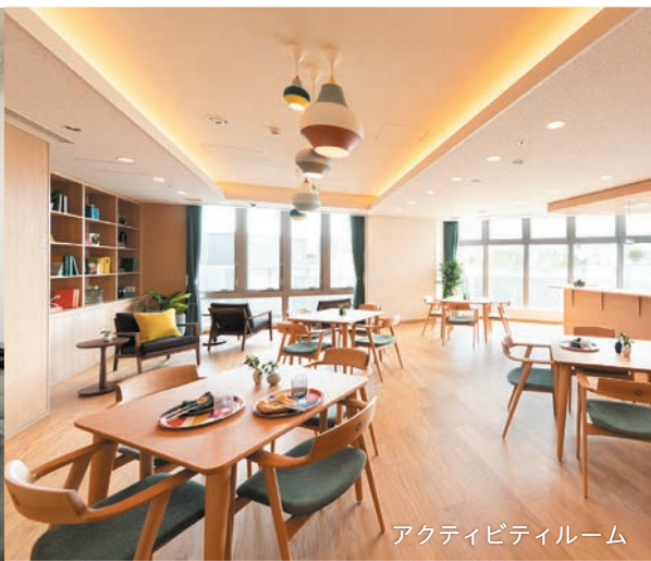
アクティビティルーム