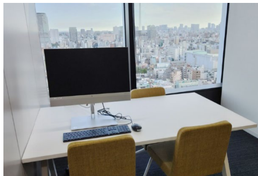
模擬事務所イメージ