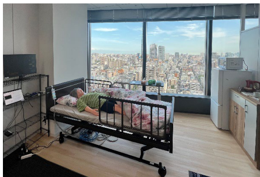
模擬在宅イメージ