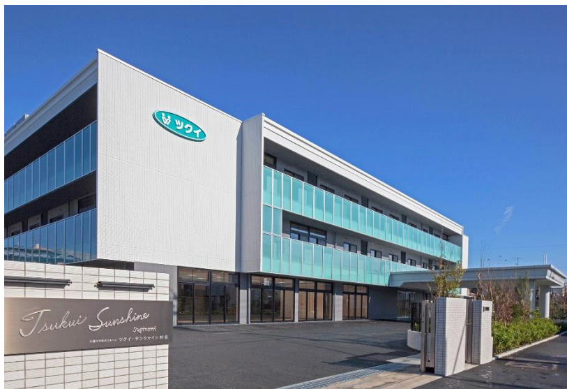
「ツクイ・サンシャイン杉並」外観