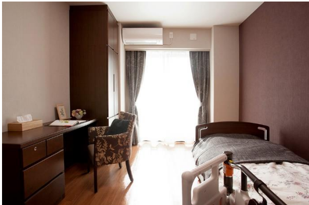
一人部屋イメージ

併せて、中庭が見える開放的なエントランス、外光を取り入れた食堂、機能訓練スペース、談話室、カフェテリア。浴室設備は、車いすのまま入浴できる広いスロープのある一般浴のほか、特殊浴、個室浴も整備しています。これら多彩な共用施設を配して、大型施設ならではの四季を感じる解放感のある空間を提供します。