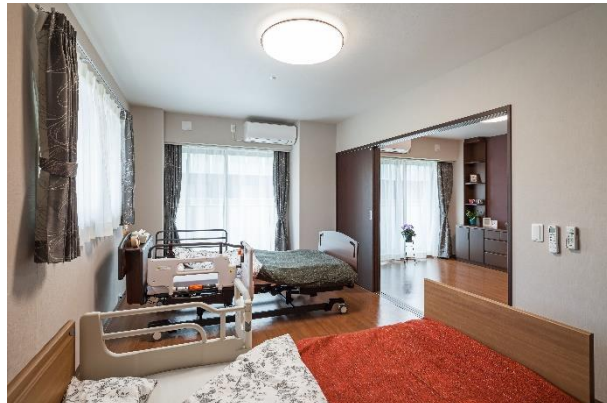
夫婦部屋イメージ