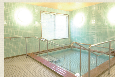
一般浴のほか、家庭のお風呂のような個浴、寝たきりの方も入浴可能な特殊浴槽があり、お身体の状態に合わせた入浴が可能です。

開放感あふれるエントランス。毎日のおしゃべりや面会時の団らんに、自由におくつろぎいただけます。