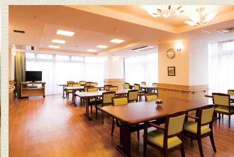
各所に椅子やテーブルを設置。食堂や談話室は自由にご利用可能です。居室以外にも居場所がたくさんあります。