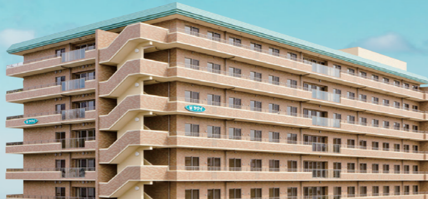
土地・建物の権利形態/建物賃借(2012年4月より30年契約)