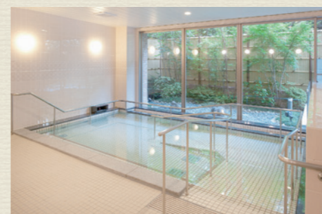
気持ちよく入浴できるよう清潔感を保ちながらも、安全にご入浴できる一般浴室。車椅子のままでも入浴することができます。