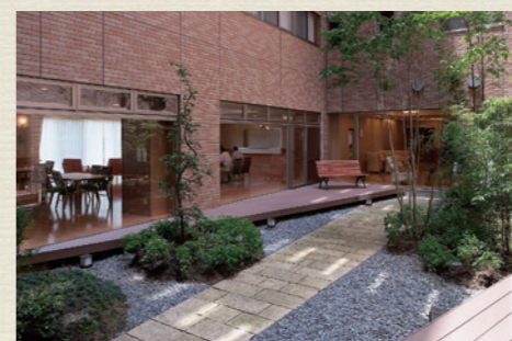
四季の移ろいを目で楽しめる中庭。天気の良い日は、中庭に入り、ベンチなどでくつろぐことができます。