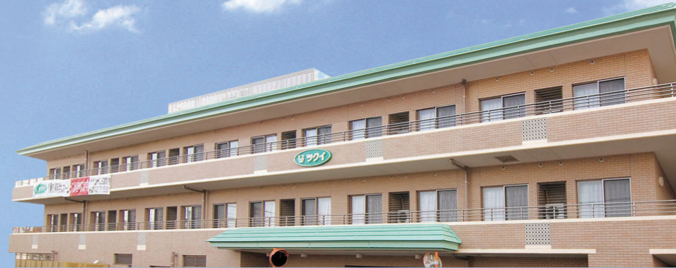
土地・建物の権利形態 / 建物賃借(2007年12月より25年契約)