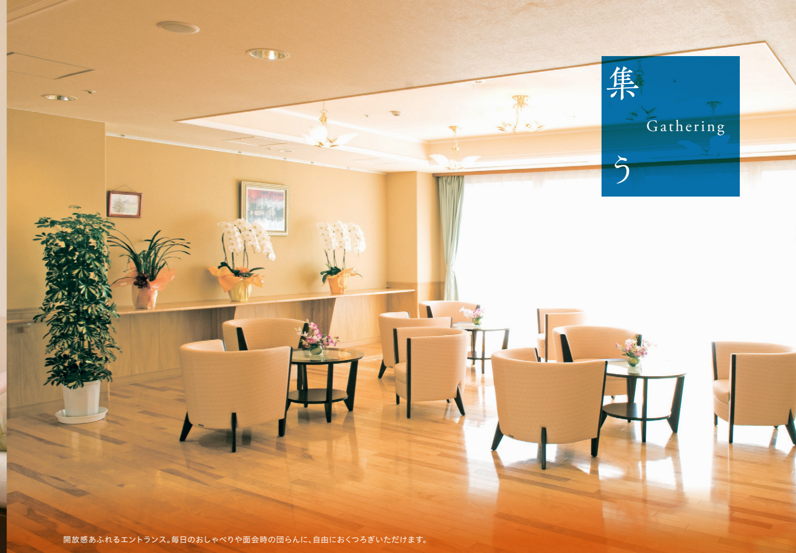
開放感あふれるエントランス。毎日のおしゃべりや面会時の団らんに、自由におくつろぎいただけます。