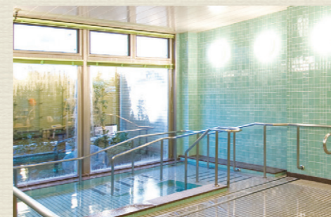
一般浴のほか、家庭のお風呂のような個室、寝たきりの方も入浴可能な特殊浴槽があり、お身体の状態に合わせた入浴が可能です。