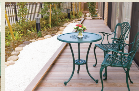
各所に椅子やテーブルを設置。食堂や談話室は自由にご利用可能です。居室以外にも居場所がたくさんあります。