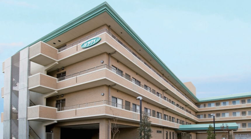
土地・建物の権利形態 / 建物賃借 (2007年5月より25年契約)