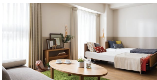
2名様居室イメージ