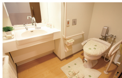
【洗面台】蛇口は自動水栓です。 【温水洗浄便座付トイレ】介助バー、コールボタンも完備