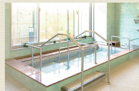
一般浴のほか、家庭のお風呂のような個別、寝たきりの方も入浴可能な特殊浴槽があり、お身体の状態に合わせた入浴が可能です。