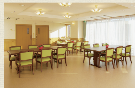
各所に椅子やテーブルを設置。食堂や談話室は自由にご利用可能です。居室以外にも居場所がたくさんあります。