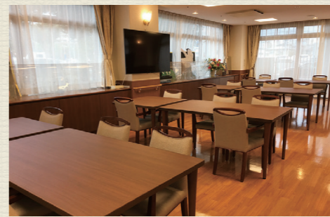
各所に椅子やテーブルを設置。食堂や談話室は自由にご利用可能です。居室以外にも居場所がたくさんあります。