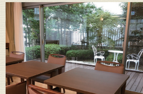
解放感あふれるエントランス。毎日のおしゃべりや面会時の団らんにも、自由におくつろぎいただけます。