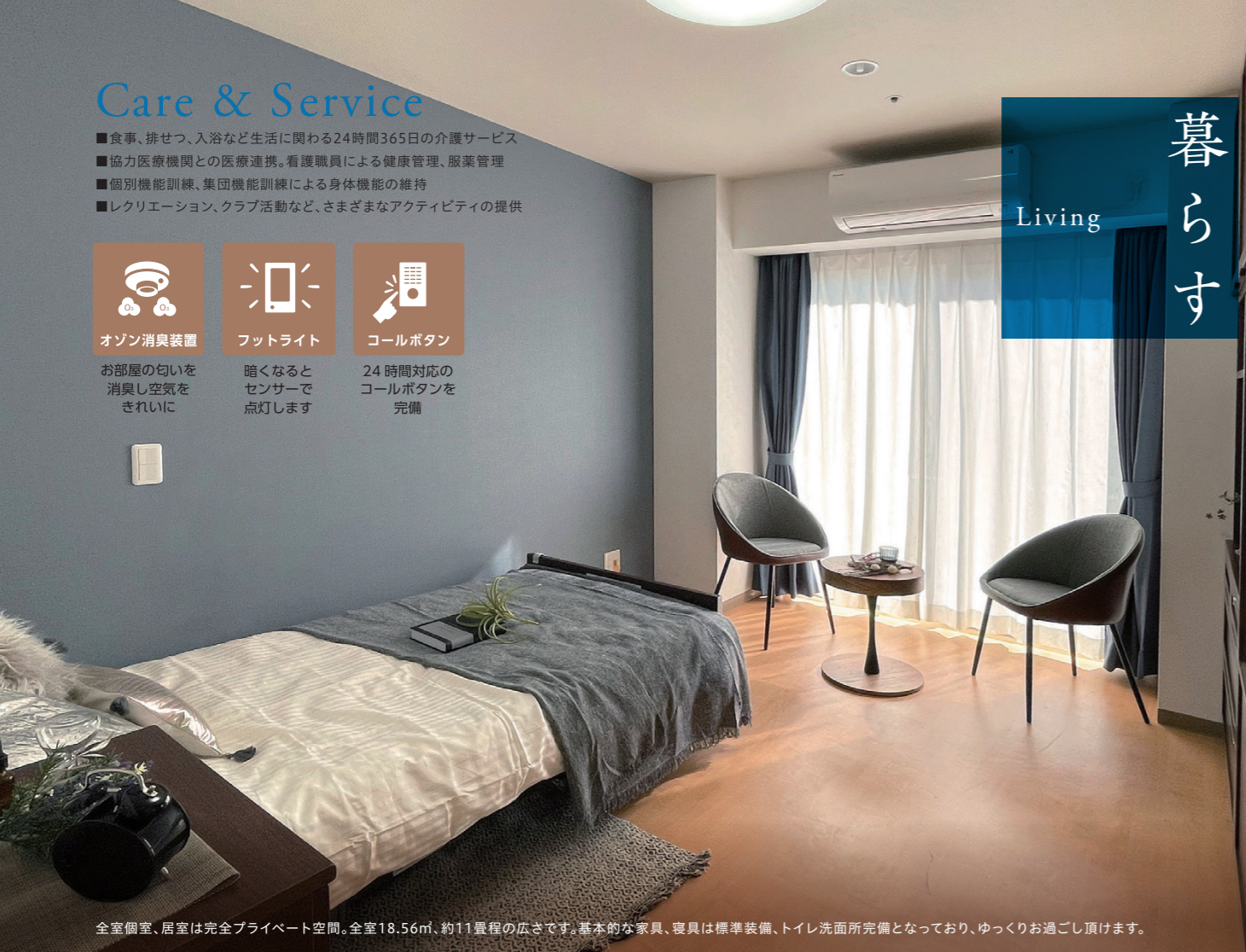
全室個室、居室は完全プライベート空間。全室18.56㎡、約11畳程の広さです。基本的な家具、寝具は標準装備、トイレ洗面所完備となっており、ゆっくりお過ごし頂けます。