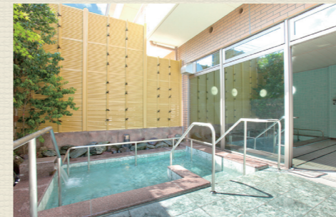
一般浴のほか、家庭のお風呂のような個室、寝たきりの方も入浴可能な特殊浴槽があり、お身体の状態に合わせた入浴が可能です。