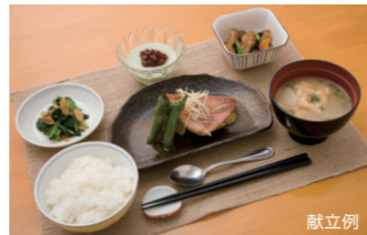
糖尿病、腎臓病などの特別食にも対応可能です。