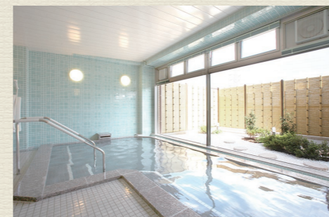
一般浴のほか、家庭のお風呂のような個浴、寝たきりの方も入浴可能な特殊浴槽があり、お身体の状態に合わせた入浴が可能です。