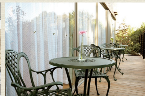
各所に椅子やテーブルを設置。食堂や談話室は自由にご利用可能です。居室以外にも居場所がたくさんあります。