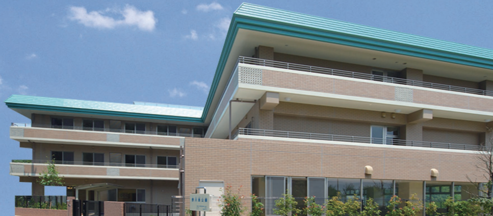
土地・建物の権利形態 / 建物賃借 (2009年8月より25年契約)